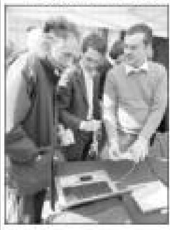
La speditissima riforma in porto

Pordenone Una speditissima riforma in porto. Il presidente della Provincia di Pordenone, Giuseppe Zillo, ha convocato i sindaci per discutere la riforma del governo regionale. Zillo ha detto che la riforma è stata approvata dal Consiglio regionale e che ora tocca ai sindaci. Zillo ha detto che la riforma è stata approvata dal Consiglio regionale e che ora tocca ai sindaci. Zillo ha detto che la riforma è stata approvata dal Consiglio regionale e che ora tocca ai sindaci. di pagina 11